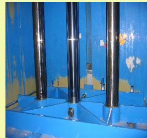
1 - Vérin double effet à tige chromée dur et 2 colonnes de guidage