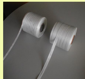
5 - Bobines de liens textiles polyester souple de 19 mm haute résistance