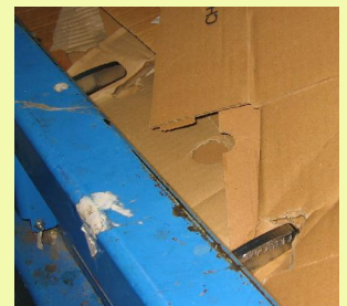
4 doigts de retenue sur la porte avant et 2 sur la structure arrière

Cet appareil est conforme à la réglementation en vigueur. Du fait de sa politique d'amélioration constante de ses produits, la société ACTIV/PRESS se réserve le droit de procéder sans préavis à des modifications techniques.