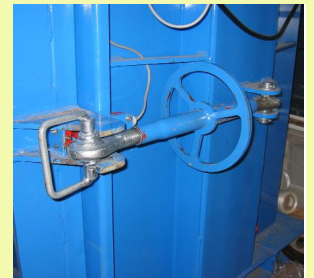
2 - Volant d'ouverture à décompression totale