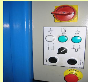
3 -Pupitre de commande avec voyants lumineux