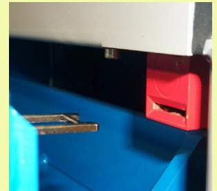
4 - Capteur de sécurité de porte